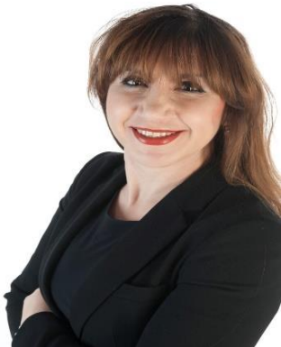
Cigdem Zantingh Rijnland Instituut